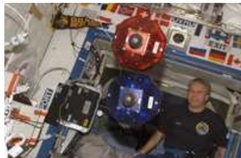
L'astronauta Thomas Reiter con gli SPHERES