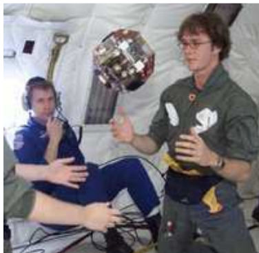
Studenti del MIT che collaudano un prototipo del robot SPHERES

Tre SPHERES in volo libero lavorano insieme all'interno della Stazione Spaziale. Sono indipendenti, ciascuna con la propria energia, i loro propulsori, i computer e i sistemi di navigazione. I risultati ottenuti con questi SPHERES sono importanti per la manutenzione, l'assemblaggio di satelliti, lo studio delle manovre di attracco (docking) e il volo di formazione.